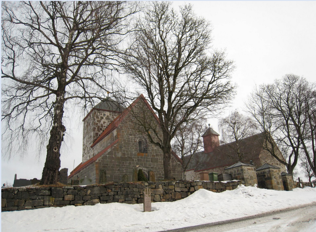
Design: Marit Heggenhougen | emykdesign.no